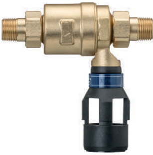
15090 - Systemtrenner CA, mit Anschlussverschraubungen