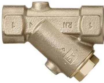
17011 - Schrägfilter