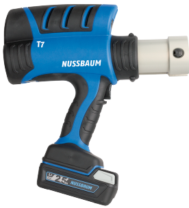
83100 - Presswerkzeug Typ 7